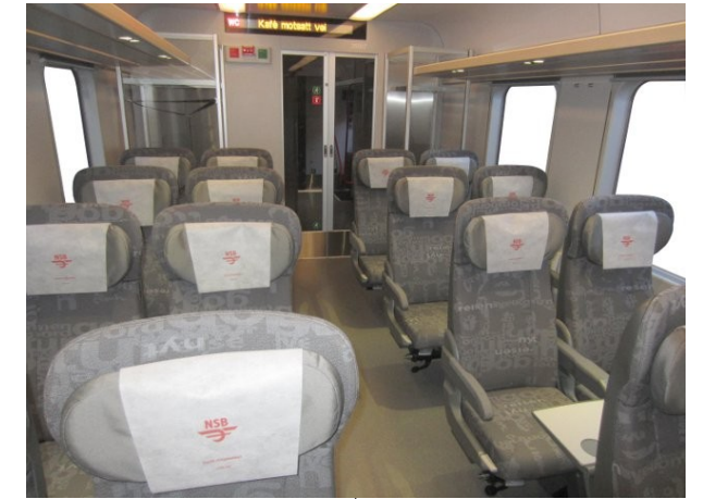
Strømuttak ved hvert sete