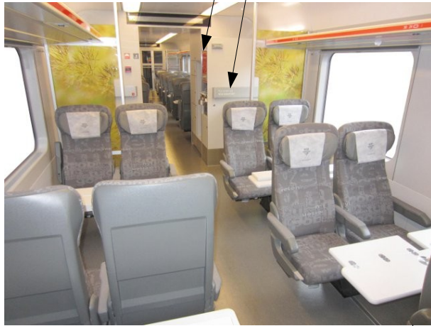
Bord og strømuttak ved hvert sete