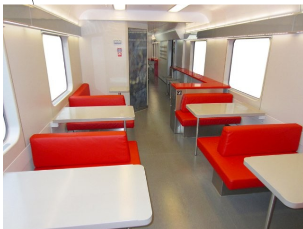
Bistro – Spiseavdeling