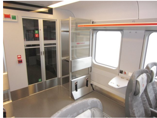
Strømuttak og alarmknapp